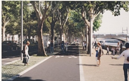
PROJET ANNEAU DES SCIENCES